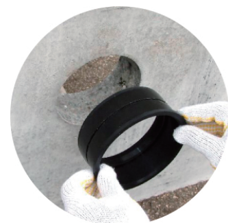
ピッタリ継手(止水ゴム継手)

塩ビ管を差し込むだけの簡単施工 塩ビ管VP・VUφ100用、φ150用があります。