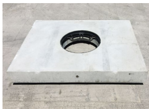
マンホール付(丸穴)