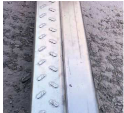
天端面はイボイボの滑り止め加工がされています。