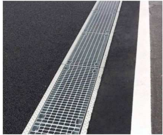
枠は角欠け防止用のZアングルになっています。